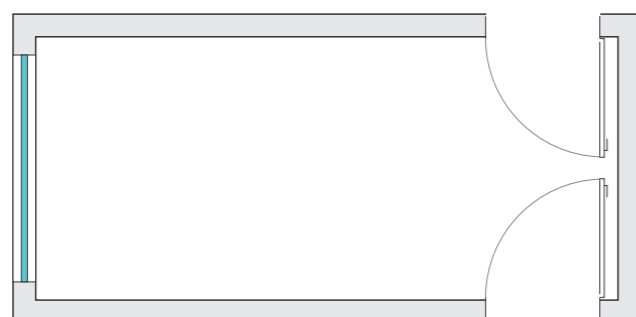
Planta - Copa / Cozinha A