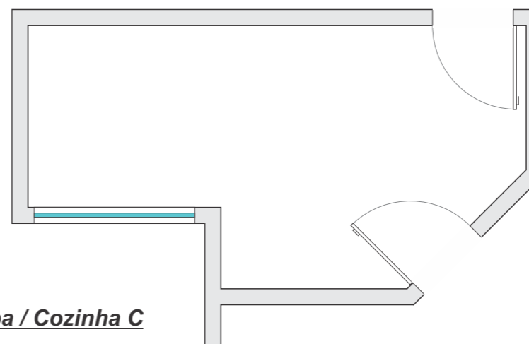
Planta - Copa / Cozinha C